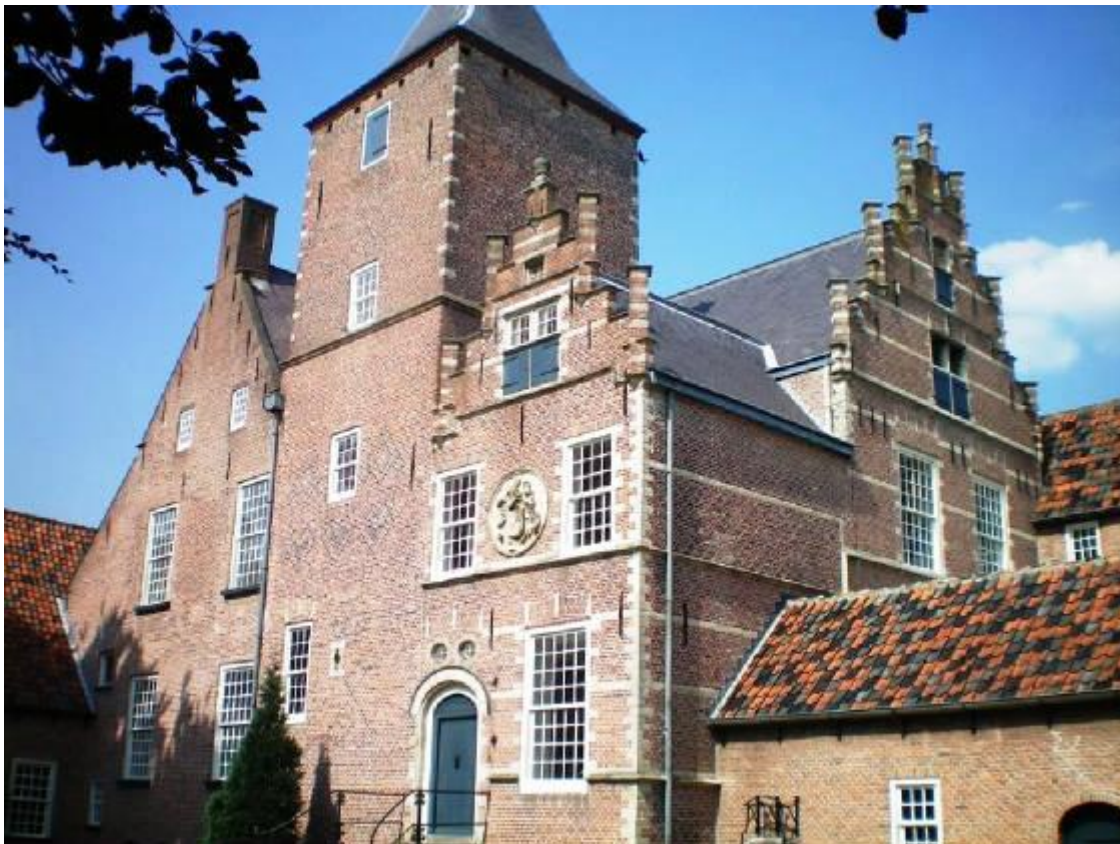
Het huidige klooster Sint-Catharinadal te Oosterhout

Voor dit vertaalproject wordt in samenwerking met de Brabantse heemkundekringen en historische verenigingen uit de 669 gepubliceerde West-Brabantse oorkonden een selectie gemaakt van kerndocumenten, zogenaamde sleutelteksten. Gestreefd wordt naar een spreiding van de oorkonden in tijd, ruimte en inhoud, naar een selectie van stukken die van historisch belang zijn en/of actuele relevantie hebben, danwel illustratief zijn voor een bepaalde ontwikkeling. Hierbij kan men denken aan de oorkonde waar de stad Bergen op Zoom zich op baseert voor de viering van het achthonderdjarig bestaan dit jaar (zie www.800jaarstad.nl ), het 'stadsrecht' van Breda, de oorkonden van Oud Gastel, voor het eerst genoemd in een vervalsing uit 1125, oorkonden over Alphen, dat al genoemd wordt in de oudste oorkonde in het Oorkondenboek van Noord-Brabant uit het jaar 709, oorkonden over Baarle, met als oudste vermelding de vervalste oorkonde van Hilzondis, gravin van Strijen, uit het jaar 992, oorkonden over de heren van Breda en Bergen op Zoom, enz.