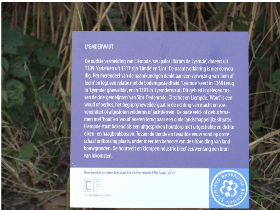
Informatiepaneel bij de bank Lyemderwaut