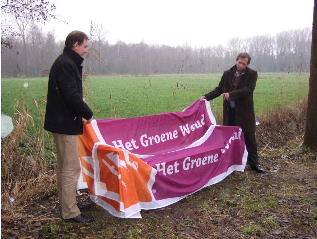
Onthulling van de bank Lyemderwaut te Liempde